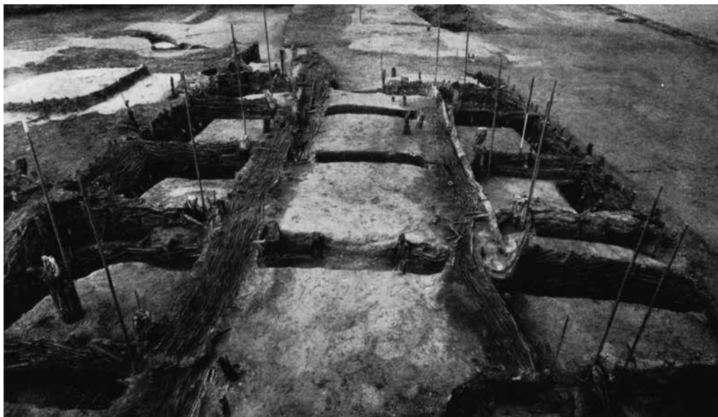
Abb. 2 Stall in einem Haus der Wurt Ezinge, Prov. Groningen, NL (aus Giffen van 1936 , Taf. 4: 1). – Obr. 2 Stáj v domě na wurtu Ezinge, provincie Groningen, NL (podle Giffen van 1936 , Taf. 4: 1).