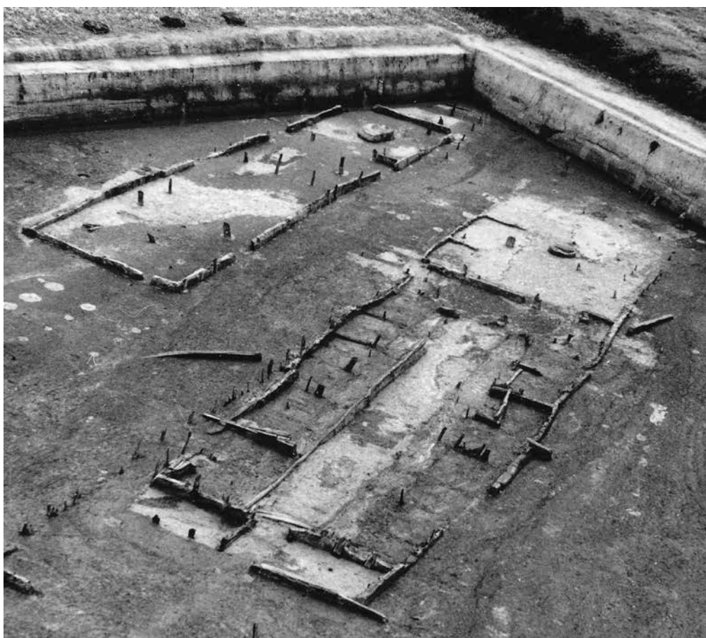
Abb. 3 Feddersen Wierde, Land Wursten, Ldkr. Cuxhaven: Haus 12, Siedlungshorizont 2. Vorne liegt der Stallteil mit Viehboxen, Mistrinnen und Mittelgang, im Hintergrund (hell) der Wohnteil mit der Herdstelle (s. Haarnagel 1979 ). – Obr. 3 Feddersen Wierde, Land Wursten, zemský okres Cuxhaven: dům 12, sídlištní horizont 2. Vpředu se nachází stájová část s boxy, odpadním žlabem, v přední (světlé) části obytná partie s ohništěm (podle Haarnagel 1979 ).