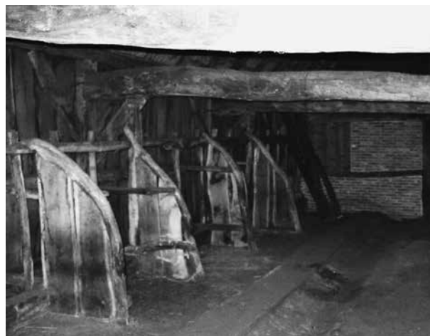
Abb. 1 Stall mit Viehboxen, Mistrinne und an der Wand einem schmalen Futtergang. Wilms Bo, Nieuw Schoonebeek, Drenthe, NL. – Obr: 1 Stáj se stájovými boxy, odpadním žlabem a krmným otvorem. Wilms Bo, Nieuw Schoonebeek, Drenthe, NL.

Erhöhte die enge Stallhaltung schon das Risiko von Krankheiten, wie Tuberkulose, so waren die extremen hygienischen Bedingungen in einem Stall, in dem das Vieh lange im hochaufliegenden Mist stand, besonders gefährlich. Das gilt für die Tiere und sehr stark auch für die Menschen durch alimentäre Infektionen durch Milch und Fleisch, z. B. tuberkulöser Rinder. Die verbesserte Hygie-