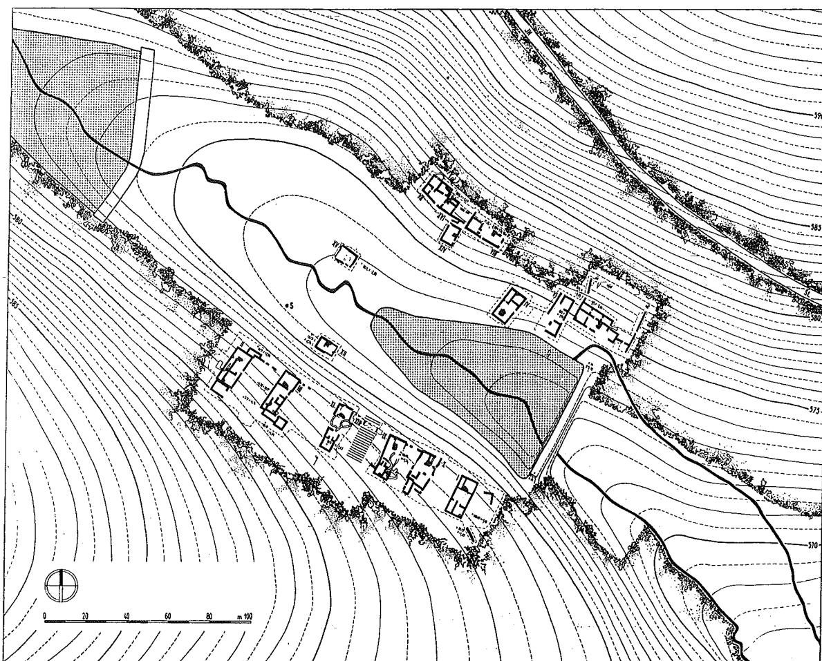
Fig. 1. DV Pfaffenschlag near Slavonice (distr. Jindřichův Hradec). Layout of the completely excavated high medieval village, 13th-15th centuries (Nekuda 1975).

1896; Smetánka - Scheufler 1963) while another group of villages was explored in the Poděbrady region (Hellich 1923). These have not lost their informative value for us (for Moravia Měřtinský 1977-78).